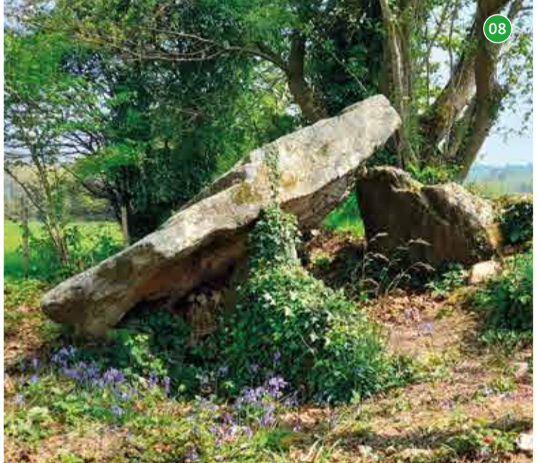
08 Allée couverte de Botquenven - Priziac : l'allée couverte est composée de deux piliers en place, deux autres basculés et le cinquième couché sous l'impressionnante dalle de couverture conservée. Le monument se prolonge dans le talus qui constitue probablement les restes du tumulus recouvrant la tombe.

Ce patrimoine archéologique est fragile et non-renouvelable ! Sensibiliser le public, nombreux et curieux à s'intéresser à ce patrimoine, est indispensable à sa protection et sa conservation. Un inventaire archéologique a été entrepris en 2005 à l'échelle du Pays du Centre Ouest Bretagne (COB). Cette vaste opération, portée par le Pays COB en collaboration avec le service régional de l'archéologie de Bretagne, a été largement valorisée afin d'en restituer les résultats au public. Il en est sorti une publication, une exposition, des dispositifs d'interprétation in-situ et un site internet très complet www.kreizyarcheo.bzh .