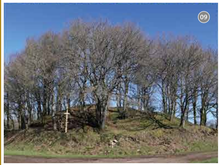
09 09 - Tumulus de Kermain - Langonnet : sa taille renvoie au prestige de son occupant ! D'un diamètre de 30 m pour une hauteur de 4 m, le tumulus de Kermain ou de Minez Collobert est attribué, par sa morphologie, à un monument funéraire de l'âge du Bronze. Cette tombe princière est encore bien conservée malgré d'anciennes fouilles sauvages.

Retrouvez les cinq Coups de Cœur de cette carte et sur le site internet www.coeurdebretagne.bzh .