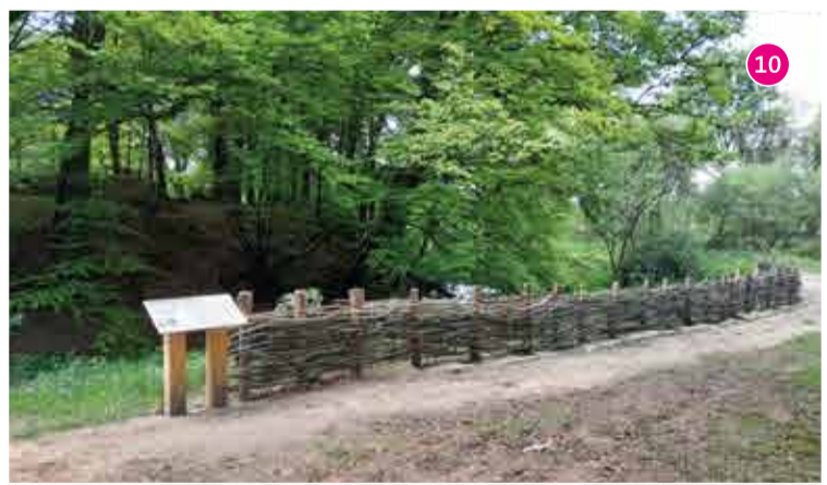
10 Motte de Kermain - Langonnet : première occupation des seigneurs de Kermain, l'imposant tertre rectangulaire a été élevé avec les terres provenant du creusement du fossé circulaire. Il était surmonté au XI e ou XII e siècle d'un donjon de bois. Caractéristique du milieu du Moyen Âge, ce type de construction défensive est l'ancêtre du château fort.