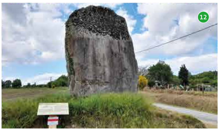
12 Menhir de Kerlivio - Berné : la pierre dressée de Kerlivio serait, d'après des témoignages mentionnant l'existence de « piliers », une ancienne dalle de couverture d'un dolmen utilisé comme abri par les habitants du village lors des bombardements de la seconde guerre mondiale.