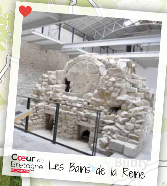
Cœur de Bretagne Les Bains de la Reine