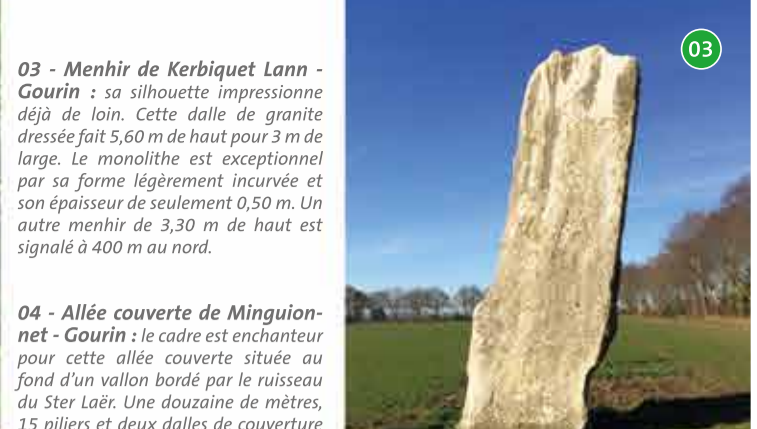
03 03 - Menhir de Kerbiqquet Lann - Gourin : sa silhouette impressionnante déjà de loin. Cette dalle de granite dressée fait 5,60 m de haut pour 3 m de large. Le monolithe est exceptionnel par sa forme légèrement incurvée et son épaisseur de seulement 0,50 m. Un autre menhir de 3,30 m de haut est signalé à 400 m au nord.