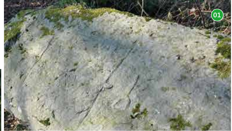
01 Alignement de Guernangoué - Roudouallec : le site est composé de trois longs blocs de schiste dont un seul est encore dressé. Une superbe gravure est visible sur l'un des blocs couchés - un motif en écusson (parfois qualifié de déesse mère) associé à un motif en «P» interprété comme une hache emmanchée.

Le Fauoët 3 rue des Cendres 56320 LE FAOUËT +33 (0)2 97 23 23 33 lefaouet@tourismepaysroimorvan.com JUILLET-AOÛT JULY-AUGUST lundi au samedi Monday to Saturday 9h30 - 13h / 14h - 18h dimanche et jours fériés Sunday and bank holidays 10h - 13h AVRIL-MAI-JUIN-SEPTEMBRE-OCTOBRE MAY, MAY, JUNE, SEPTEMBER, OCTOBER mardi au samedi Tuesday to Saturday 10h - 12h30 / 14h - 17h30 NOVEMBRE À MARS NOVEMBER TO MARCH mardi au samedi Tuesday to Saturday 10h - 12h30 / 14h - 17h30 fermé le jeudi Closed on Thursday Gourin 24 rue de la Libération 56110 GOURIN +33 (0)2 97 23 66 33 gourin@tourismepaysroimorvan.com JUILLET-AOÛT JULY-AUGUST lundi au samedi Monday to Saturday 9h30 - 12h30 / 14h - 18h jours fériés Bank holidays 10h - 12h30 SEPTEMBRE À JUIN SEPTEMBER TO JUNE lundi-mercredi-vendredi Monday-Wednesday-Friday 10h - 12h30 / 14h - 17h30 Guémené-sur-Scorff Les Bains de la Reine - 5 place du Château 56160 GUÉMENÉ-SUR-SCORFF +33 (0)2 97 28 01 20 guemene@tourismepaysroimorvan.com JUILLET-AOÛT JULY-AUGUST lundi au dimanche Monday to Sunday 9h30 - 13h / 14h - 18h30 JUIN ET SEPTEMBRE JUNE AND SEPTEMBER mardi au dimanche Tuesday to Sunday 10h - 12h30 / 14h - 18h OCTOBRE À MAI OCTOBER TO MAY mardi au samedi Tuesday to Saturday 10h - 12h30 / 14h - 17h30 jours fériés - se renseigner Inquire for bank holidays