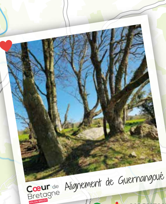
Cœur de Bretagne Alignement de Guernangoué