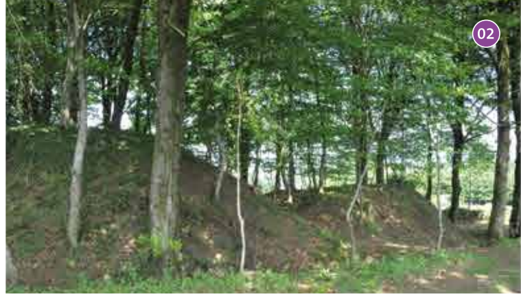
02 Enceinte médiévale de Castel Vouden - Roudouallec : le château de la motte, Castel Vouden en breton, comme l'ont nommé les anciens, a longtemps été désigné comme le « camp romain ». Il s'agit en réalité d'une enceinte médiévale pourvue d'un large talus en terre servant de rempart et probablement surmonté à l'origine d'une palissade en bois.