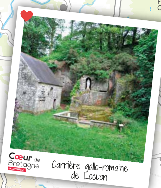
Cœur de Bretagne Carrière gallo-romaine de Locuon