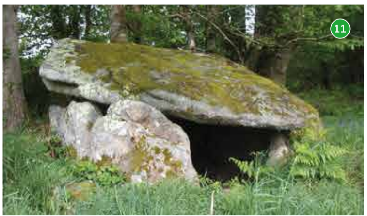
11 Dolmen de Guidfasse - Plouray : isolé, au bout d'un plaisant chemin arboré, se dresse ce bel exemple de tombe mégalithique. Elle est constituée d'une chambre recouverte par une dalle de couverture imposante d'un poids estimé entre 8 et 10 tonnes qui repose sur 6 piliers en granite.