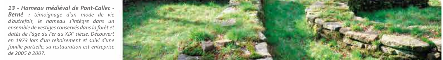
13 13 - Hameau médiéval de Pont-Callec - Berné : témoignage d'un mode de vie d'autrefois, le hameau s'intègre dans un ensemble de vestiges conservés dans la forêt et datés de l'âge du Fer au XIX e siècle. Découvert en 1973 lors d'un reboisement et suivi d'une fouille partielle, sa restauration est entreprise de 2005 à 2007.