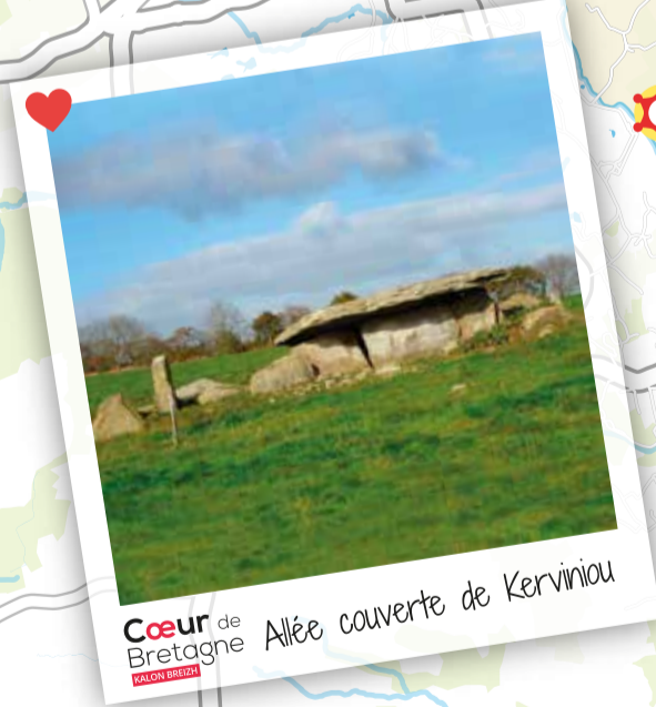
Cœur de Bretagne Allée couverte de Kerviniou