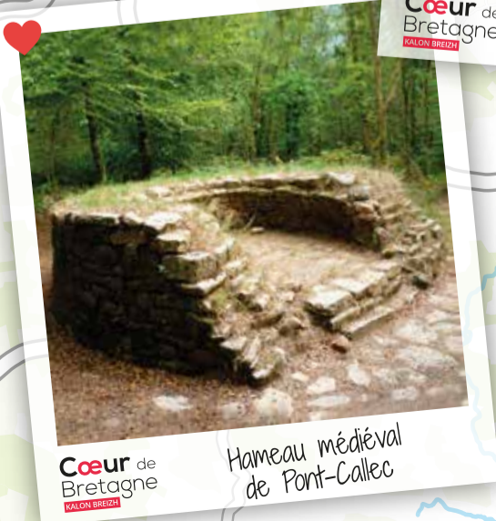
Cœur de Bretagne Hameau médiéval de Pont-Callec