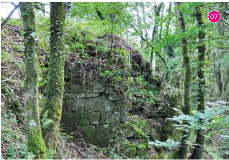
07 Château de Barrégan - Le Fauoët : surplombant la vallée de Sainte-Barbe, en vis-à-vis de la chapelle, les vestiges de cette résidence seigneuriale émergent de la végétation. Ils laissent encore deviner la complexité de ce système défensif aux fossés imposants dont la construction peut remonter au XIV e siècle.

C'est sans oublier l'habitat rural rendu visible au hameau restauré de Pont-Callec dont l'occupation perdure jusqu'au XIX e siècle. Ce site est comparable au Village de l'an mil à Melrand ou d'autres choix scientifiques et pédagogiques ont été faits, comme des reconstitutions.